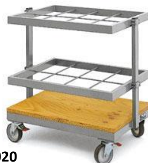
LLP – C020

Roues pivotantes montées en losange + frein