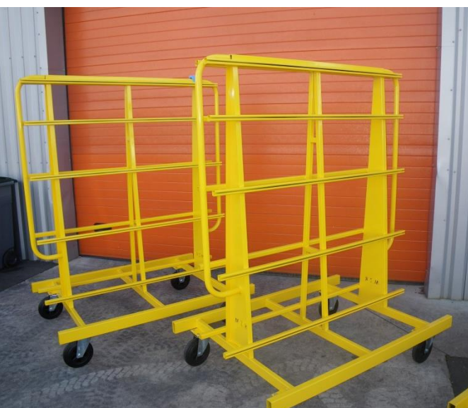
LLP – C100 Chariot de vitrages Géométrie précise pour utilisation en lignes robotisées 2 roulettes fixes et 2 pivotantes