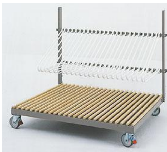
LLP – C110 Chariot stockage de vitrages (pour 24 vitrages) Séparateurs réglables en hauteur Distance entre cases = 35mm