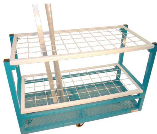
LLP – C010

Protection des profils par mailles en RILSAN