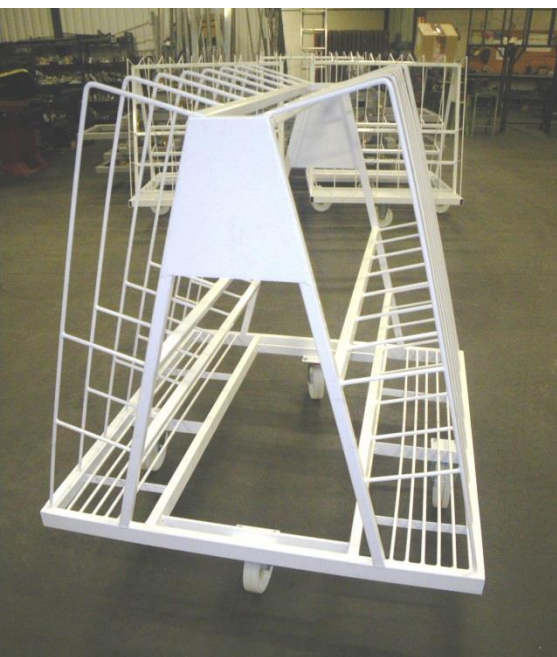
LLP – C040 Chariot de stockage vertical de profilés Utilisation seul ou en train