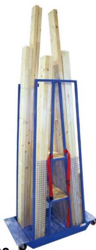
LLP – C030

Protection des profils par mailles en RILSAN