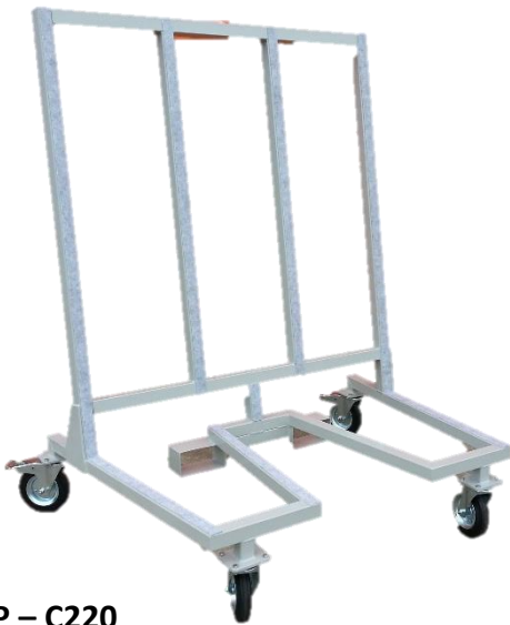
LLP – C220 Chariot de transport de cadres en vertical Dimensions adaptées à votre besoin