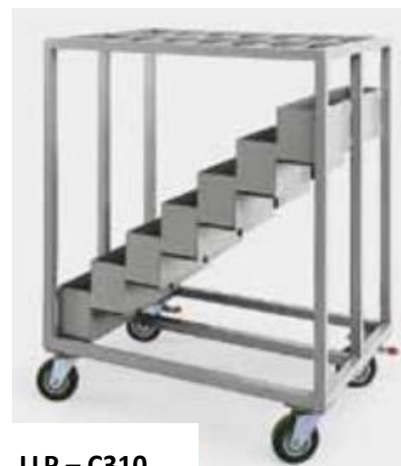
LLP – C310

Positionnement central ou constant de la poignée