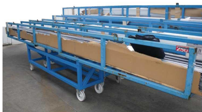
LLP – C400