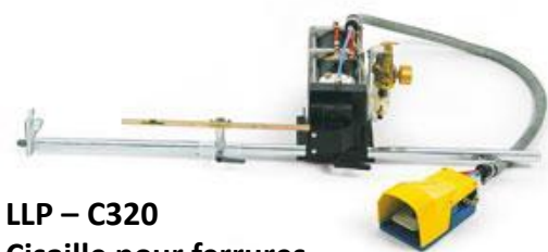
LLP – C320