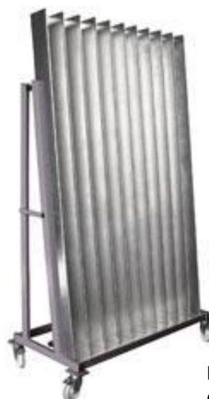
LLP – C350