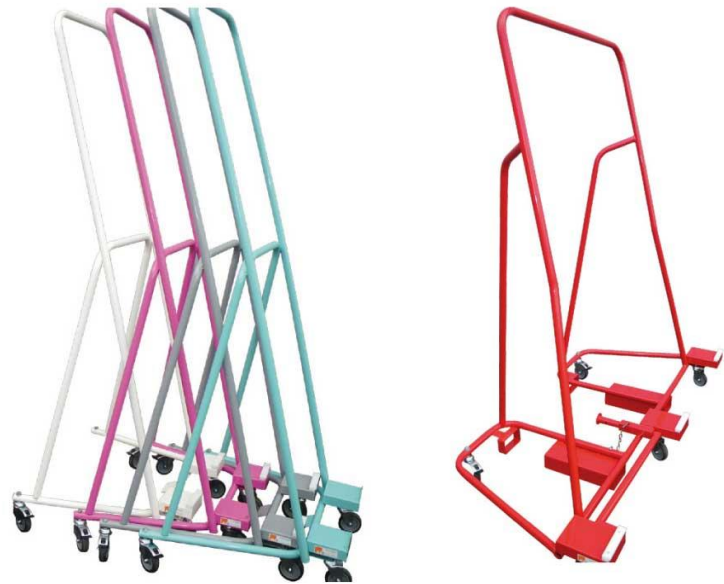
LLP – C230 Chariots de transport de portes Légers et maniables pour le transport de 1 à 3 portes Gerbable pour limiter la prise au sol Passage de fourche pour prise avec chariot élévateur

Fort d'une expérience de plus de 20 ans, les équipes de DGM industries conçoivent, fabriquent, distribuent, installent et maintiennent une gamme complète d'équipements industriels pour la transformation des profilés.