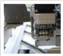
Perçage des pivots et paliers OB Taladrado de las bisagras