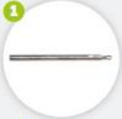
Fraise pour passage du joint Fresa para paso goma