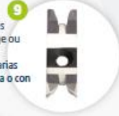
Couteau DUAL surfaces visibles pour rainurage ou affleurage Doble cuchilla para varias superficies visibles lisa o con ranura