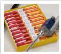
Option: Peinture automatique de la rainure après ébavure Opción: Pintado automático de la ranura después de limpieza