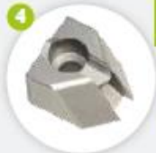
Couteau pour angle intérieur 0-70° Cuchilla de esquina interior 0-70°