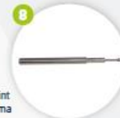
Fraise pour joint Fresa para goma