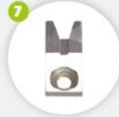
Couteau surfaces visibles : rainurage ou d'affleurage Cuchilla para superficies visibles lisa o con ranura