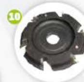
Lame fraise de contour (supérieur / inférieur) Disco fresa de contorno (superior / inferior)