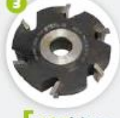
Option fraiseage pointe batterment intégré fresado de punta de marco u hoja