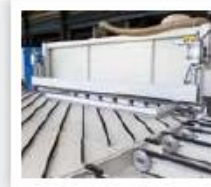
station de délignage fresadora para quitar puntas de hojas