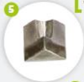
Couteau pour angle intérieur 70-90° Cuchilla de esquina interior 70-90°