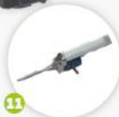
Pistolet à peindre la rainure d'angle pulverizador de pintura