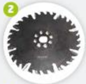
Lame pour le contour extérieur Disco de contorno exterior