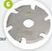
Option Lame fraise de contour (supérieur / inférieur) disco contorno interior