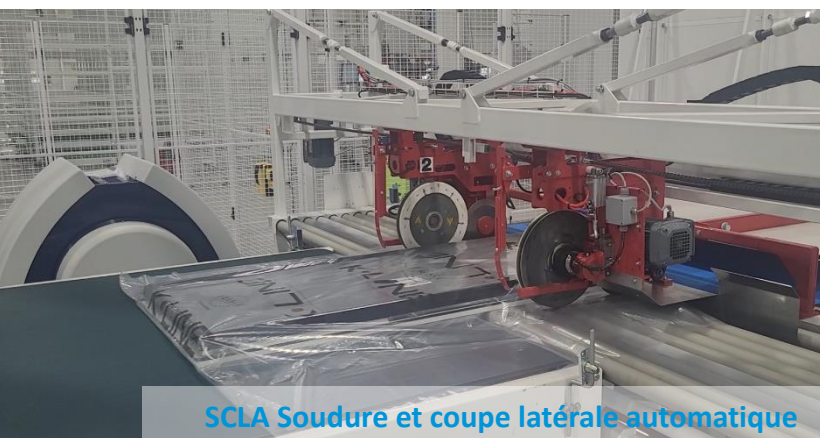
SCLA Soudure et coupe latérale automatique