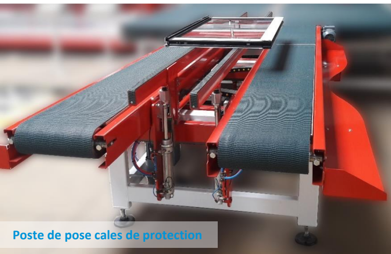
Poste de pose cales de protection