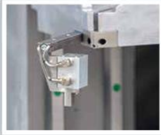
Dichtungsniederdrücker Gasket downholder