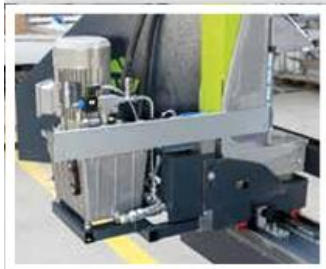
Hydraulikaggregat hydraulic unit